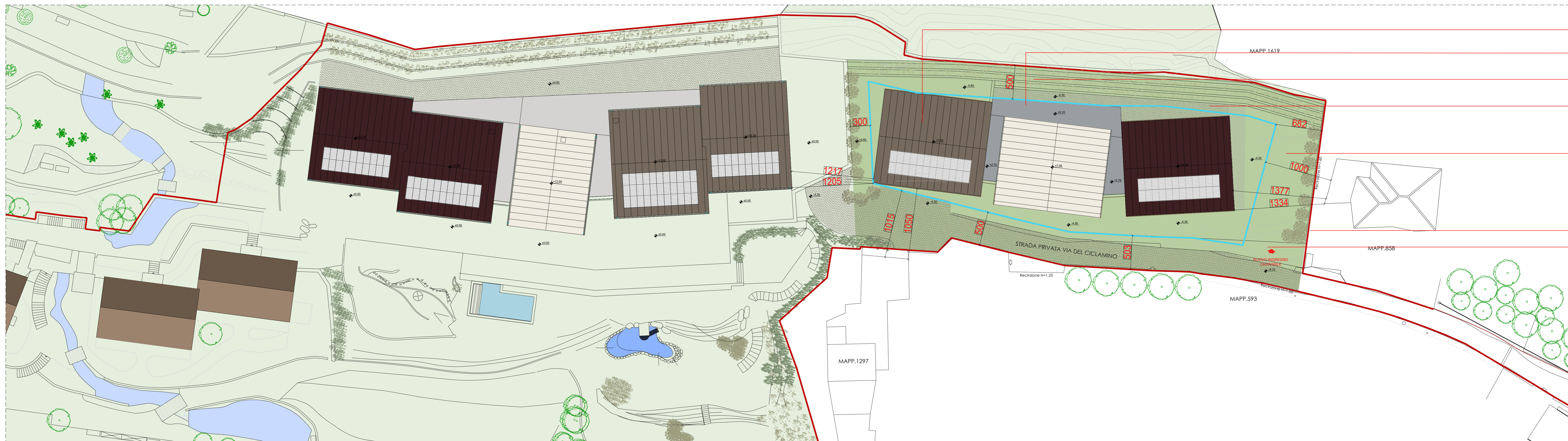
KEY PLAN SCALA 1:400