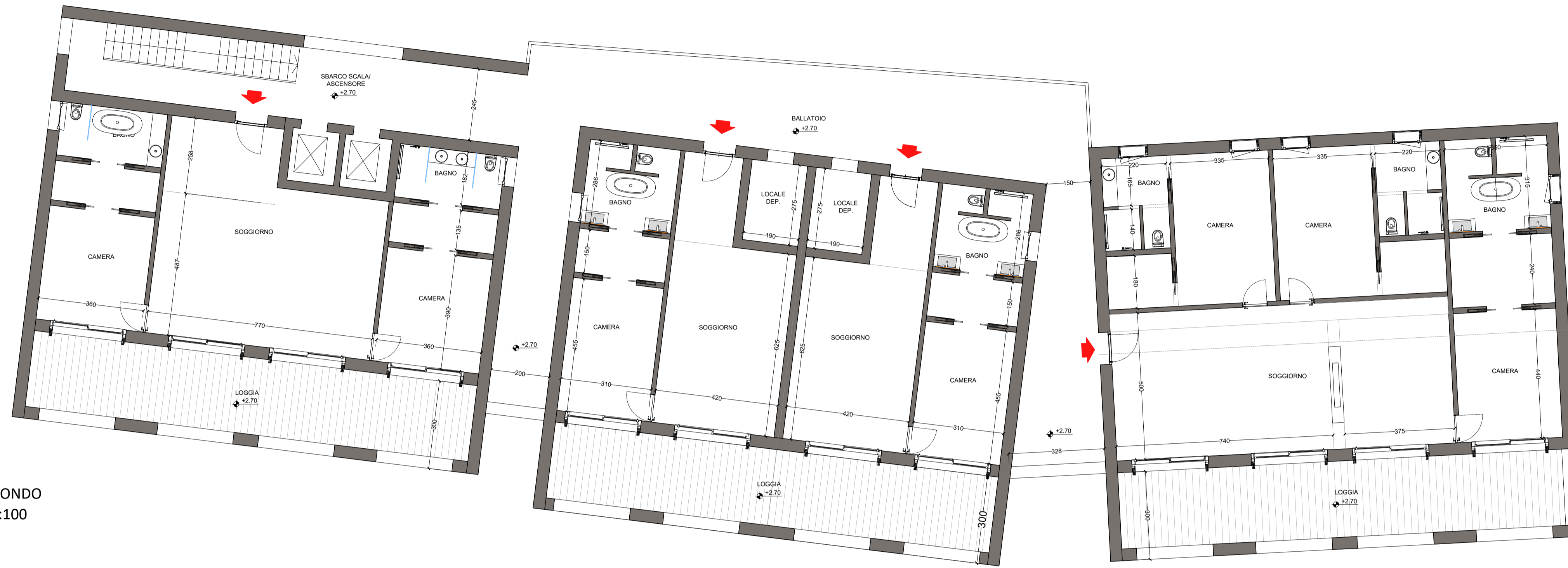
PIANO SECONDO SCALA 1:100